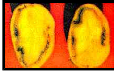
Estado más avanzado con descomposición de algunos tejidos adyacentes al anillo vascular.