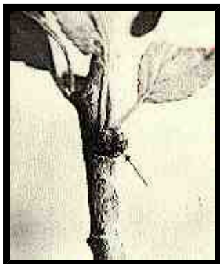
Nódulo inmaduro causado por Apiosporina morbosa en madera de 2 años localizado en la yema foliar; el tiempo de desarrollo es de 3,5 meses luego de la infección